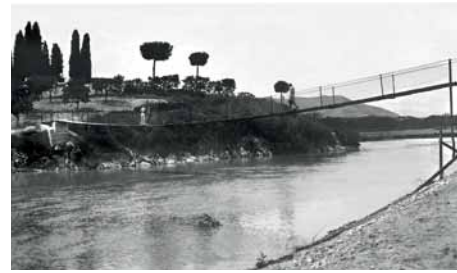
Diferents sistemes per passar el riu en les primeres dècades del segle XX