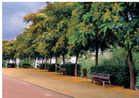
Florida de les tipuanes

Un cop a dalt, la part alta del mur que ressegueix l'autovia ha esdevingut un atractiu passeig mirador. D'allà surt el pont que creua el riu (com feien les antigues palanques) i que permet enllaçar amb el camí de ribera del marge esquerre. Una filera de tipuanes ombrreja el passeig. Quan floreixen, al final de la primavera, s'omplen de flors grogues que en caure formen una bonica catifa de color. Des del passeig i des del pont es gaudeix de bones vistes sobre aquest sector de la vall baixa del Llobregat, el nucli enlairat de Castellbisbal i les muntanyes de Montserrat, aigües amunt a l'horitzó.