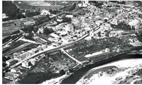
La zona del parc i el seu entorn cap a 1960

El riu Llobregat ha estat l'element que ha marcat la vida de Sant Andreu de la Barca des que se'n tenen notícies històriques fins fa més o menys cinquanta anys. Les terres fèrtils que el riu generosament ha anat dipositant al llarg dels segles van permetre el desenvolupament d'una agricultura que ha estat font de vida per al municipi i que va perdurar fins ben avançats els anys seixanta del segle passat.