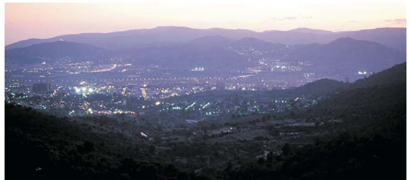
Els punts de llum al capvespre, ens permeten veure des del mirador turó d'en Cors la zona urbanitzada i la no urbanitzada de la vall

Visió urbanística frontal de Vallvidrera per apreciar com el desig d'un bell esguard sobre el pla de Barcelona ha originat una fal·lera constructiva per anar-se situant en els millors llocs.