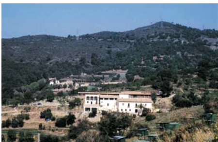
can Fatjó i can Merlés en segon terme

Visió urbanística sobre Can Caralleu Tot pujant al Mirador d'en Cors podem veure com les excavadores i el ciment van esgarrapant les zones verdes que encara es poden veure, de forma testimonial, en alguns trams de la pendent barcelonina de Collserola.