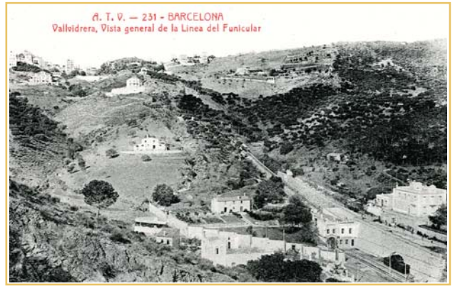
postal del funicular de Vallvidrera als anys 20 del segle passat

La Vall de Sant Just? Estem en vespres de veure-la per darrera vegada? Interessos immobiliaris pretenen construir uns 1.200 habitatges i, sembla, que amb possibilitats d'aconseguir-ho. Canviarem el paisatge de garrofers, alzines, pins, rieres .... per balcons, terrats, aparcaments, ciment en general?. Augmentarem encara més la pressió humana sobre el Parc de Collserola?